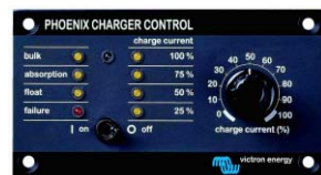
Tableau 'Phoenix Charger Control'

Alarme visuelle et sonore en cas de tension batterie trop haute ou trop basse. Seuils de déclenchement réglables. Contact sec pour signalisation déportée.