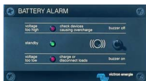
Tableau 'Battery Alarm'

Alarme visuelle et sonore en cas de tension batterie trop haute ou trop basse. Seuils de déclenchement réglables. Contact sec pour signalisation déportée.